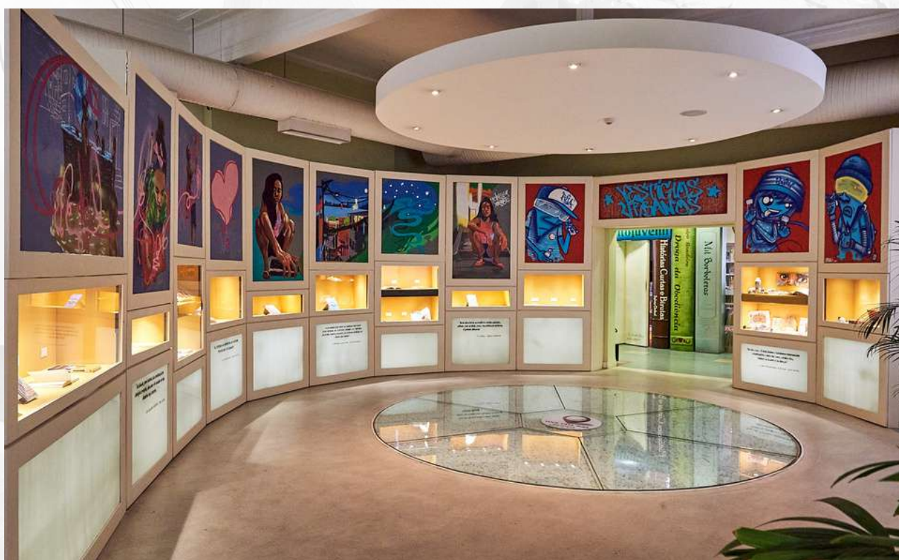
VESTÍGIOS URBANOS (CCBB-RJ)